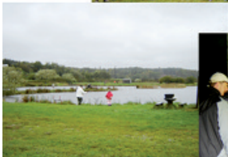
En god dag for Metal-folkene.