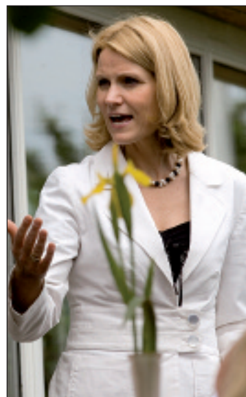
Helle Thorning Schmidt fremlagde et overbevisende program for Danmark.

værende statsminister, Anker Jørgensen 85 år. I den anledning havde en række kunstnere valgt at hylde Anker med en udgivelse af en cd under titlen: De største, er de små. En helt passende titel, når talen falder på Anker.